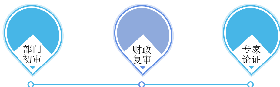
图 1 绩效目标审核主要流程图

根据《预算法》及绩效管理制度，绩效目标审核由财政部门牵头，联合审计、业务主管部门组成审核小组。审核流程包括：部门初审。业务科室自审目标合理性，提交书面说明；财政复审。重点审查目标与政府职能、年度工作计划的一致性；专家论证。对专业性较强的工业集中区规划等项目，邀请第三方机构评估可行性。